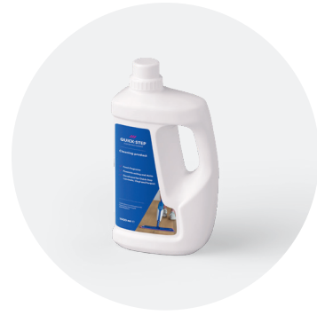
Reinigingsmiddel 1 l of 2,5 l QSCLEANING1000 QSCLEANING2500

Dit reinigingsmiddel is speciaal ontwikkeld voor Quick-Step-vloeren. Het reinigt het oppervlak grondig en behoudt het originele uitzicht, zodat je extra lang van je nieuwe vloer kunt blijven genieten.