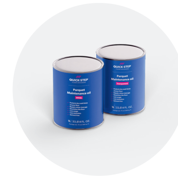
Onderhoudsolie 1 l QSWMAINTOILN / QSWMAINTOILW

Met deze set kun je eenvoudig lichte beschadigingen herstellen en de oorspronkelijke kleur van je vloer weer herstellen. Voor gedetailleerde stapsgewijze instructies, zie quickstep.com .